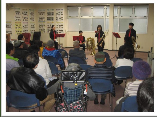
♪ クリスマスコンサート 出演：てんとうむし音楽隊