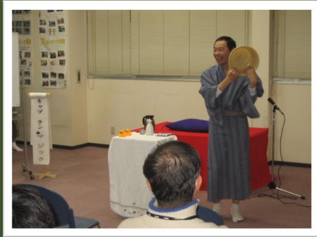
☆ 落語 出演：左うちわの会