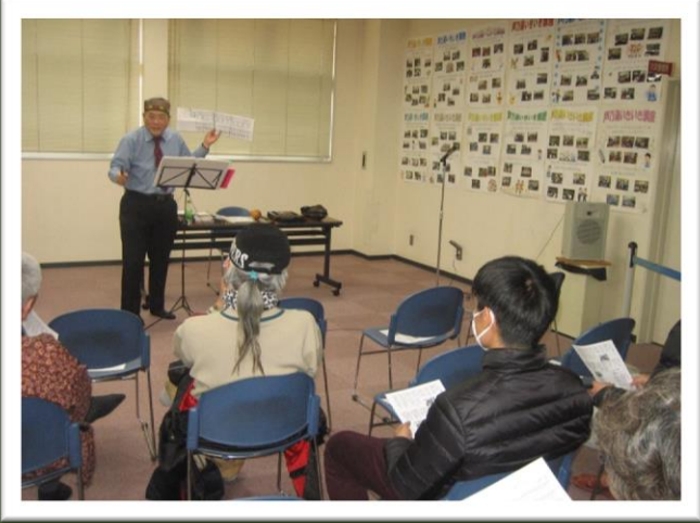
♪ ハーモニカ、瓢箪笛の演奏