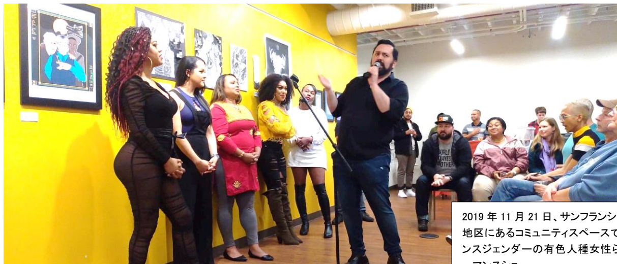
2019年11月21日、サンフランシスコ市カストロ地区にあるコミュニティスペースで行われたトランスジェンダーの有色人種女性らによるパフォーマンスショー

2008年入社。徳島、長崎支局を経て13年から現職。17年9月~19年8月、休職しサンフランシスコに留学。LGBTQコミュニティの歴史や現在の運動について、San Francisco State University や City College of San Francisco で学びながら、様々な非営利団体でボランティアをした。19年9月に復職し、LGBTQなどについて取材している。