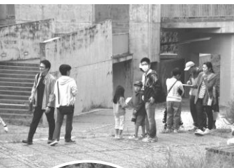
こちらは会員サークルチーム