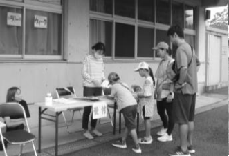
家族で受付「さあ、出発〜!」