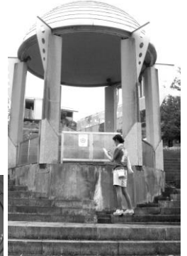
こんなところにもアイコンが!