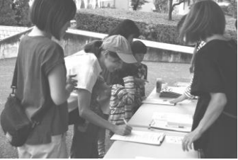
お友達同士の親子も多く…

期間の後半、雨が心配される日もありますが、参加者は会員・スタッフを含め三六〇人を超える結果となりました。