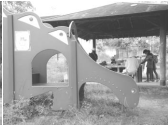
恐竜の体にアイコン見つけ!