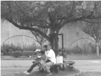
木陰のベンチでも豚汁を…