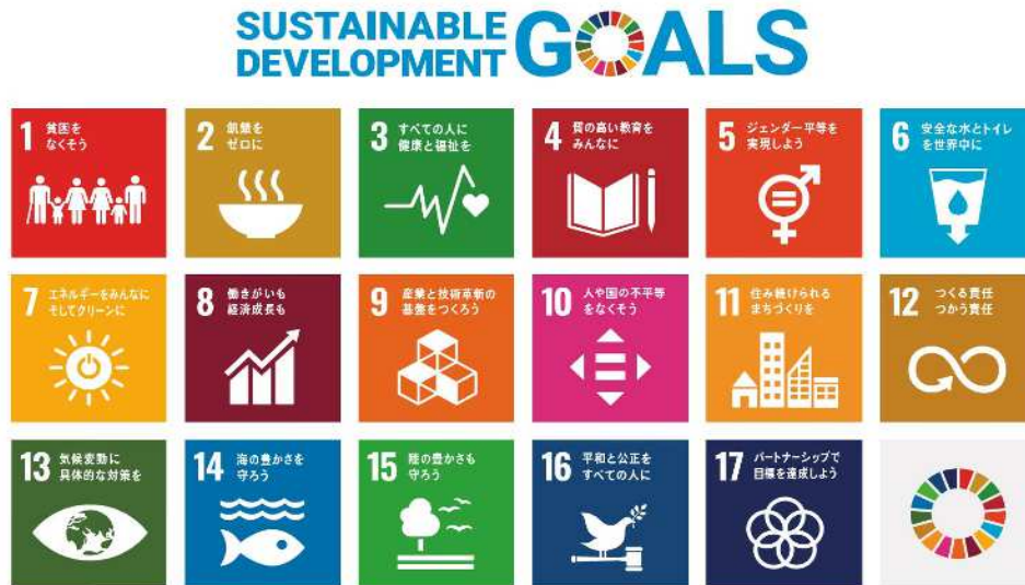
西宮市食品衛生監視指導計画とSDGsとの関係

平成27年の「国連持続可能な開発サミット」において、「持続可能な開発のための2030アジェンダ」とその17の「持続可能な開発目標（SDGs）」が採択されました。SDGs（Sustainable Development Goals）では、経済・社会・環境の3つの側面のバランスがとれた持続可能な開発に際して、複数目標の統合的な解決を図ることが掲げられています。本計画においては、市民、事業者、行政がそれぞれの役割を認識し、相互に連携・協働しながら取組みを進めることにより、特に以下に挙げるSDGsの3つの目標達成に寄与することが期待されています。