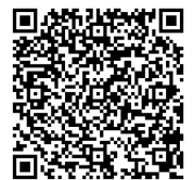
保育サポーター養成講座案内