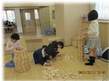
いっしょにカプラであそびました。