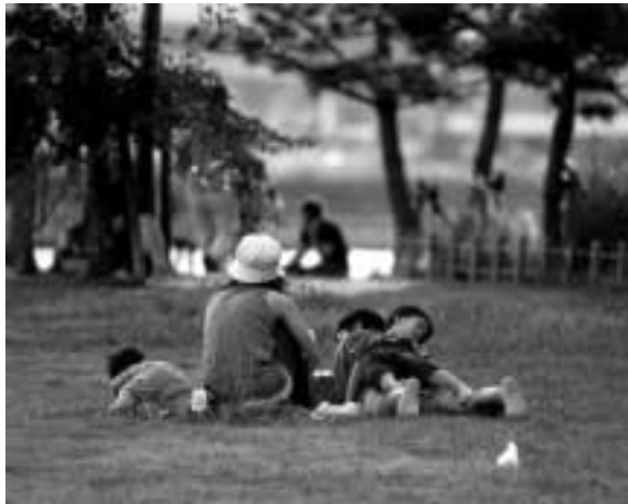
特選「パパの背中に」