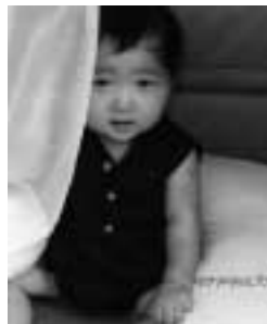
入選「あ、ママここにいたの」