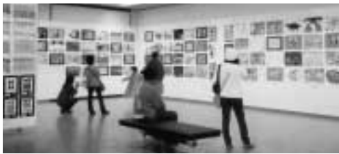
ユネスコ世界児童画展 (於市民ギャラリー)

市内の児童や世界各国の児童の描いた絵を一同に展示し、またこの絵を交換して国際交流の輪を広げています。例年3月に開催。