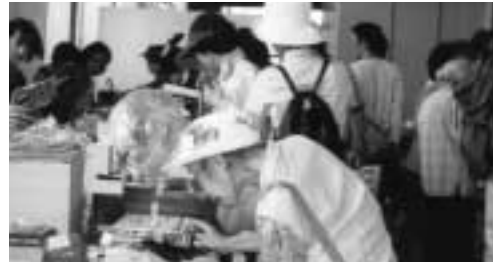
チャリティバザー (於夙川公民館)

コーアクション事業（発展途上国の開発に先進国の人々が自ら関わりを持ち、互いに協力し合う）を支援する為バザーを開催しています。