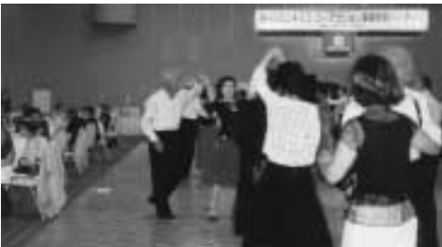
懇親パーティ (於神戸ポートピアホテル)

音楽、ダンス、食事を一緒に楽しみながら会員相互の親睦を図ります。また参加費の一部はユネスコ世界寺子屋運動に役立っています。