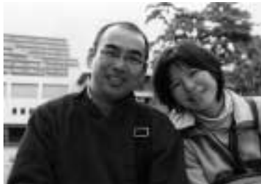
入選「おとうさんと おかあさん」