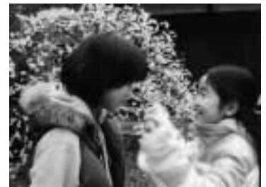
入選「ぼくのおねえちゃん」