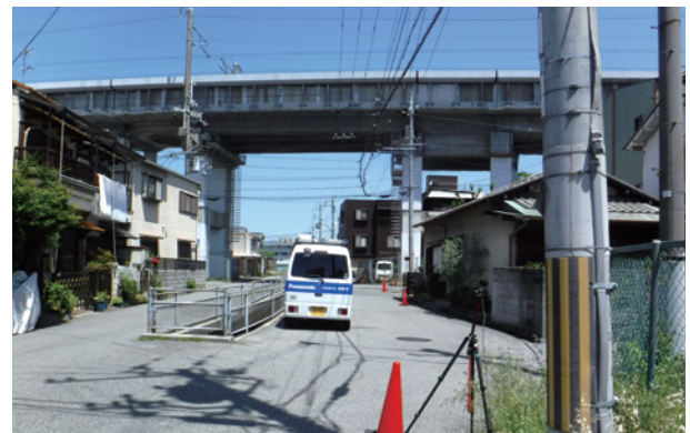
新幹線騒音の測定

西宮市内を山陽新幹線が通過しており、その距離は高架部分約1.6km(武庫川から上甲東園6丁目まで)、トンネル部分約4.7km(上甲東園6丁目から芦屋市境まで)の計6.3kmとなっています。騒音の環境基準は70dB以下です。一方、振動に係る環境基準はありませんが、指標として70dBの指針値(昭和51年(1976年)環境省勧告)があります。令和元年度(2019年度)においては、騒音は58dB~68dB、振動は、50dB~59dBと環境基準及び指針値を達成しています。