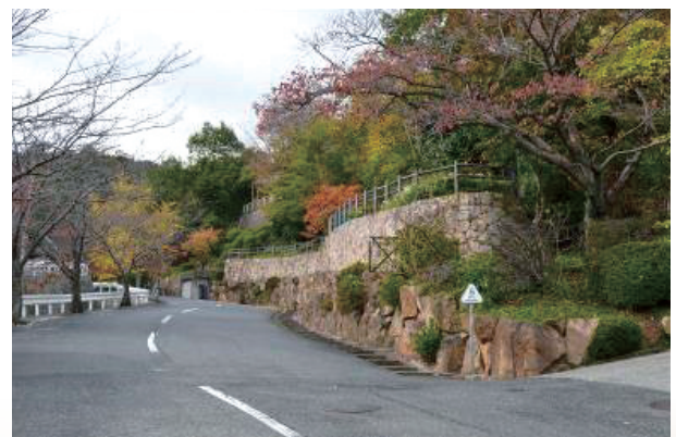
甲陽園目神山地区景観重点地区

・都市計画のそれぞれの区域の特性に相応しい良好な環境の整備と保全を図るため、地区計画制度を設けています。令和元年度（2019年度）末時点で36地区が指定されており、区域内において建築物等の制限を行っています。