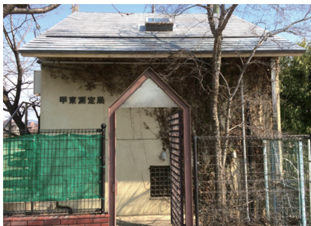
大気汚染常時監視測定局

大気汚染物質のうち環境基準が設定されているものとして、二酸化硫黄(SO 2 )、浮遊粒子状物質(SPM)、二酸化窒素(NO 2 )、一酸化炭素(CO)、光化学オキ