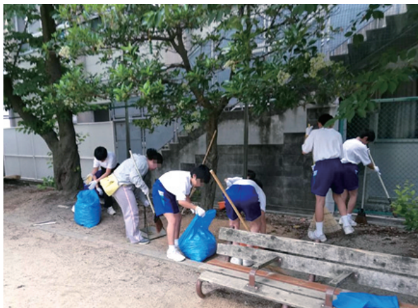
わがまちクリーン大作戦