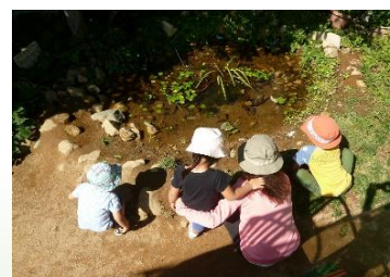
図3-6 甲東北保育所の ビオトープ

・ビオトープや観察池は、生き物の移動の中継地や、子どもたちが自然に触れ合える身近な場として重要な役割を果たしています。本市では、学校園や保育所でのビオトープの整備・活用を推進しており、市内の公立保育所では、在来種によるビオトープ（池）などが設置されています。