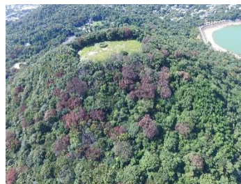
図 3-1 ナラ枯れ被害の様子

本市では、平成24年度（2012年度）に社家郷山キャンプ場周辺の2本のコナラで初めてナラ枯れの被害が確認されました。その後、平成28年度（2016年度）には、2,077本が確認され市内全域に被害が拡大しました。被害木については、危険木を中心に伐倒・くん蒸処理などを行っており、近年は減少傾向にあります。また、令和3年度（2021年度）には仁川緑地における道路沿いの斜面地において、低木であるコバノミツバツツジを試験的に植栽しており、今後も引き続き経過観察を行っていきます。