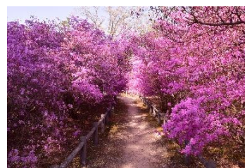
図 3-8 コバノミツバツツジ

・広田神社のコバノミツバツツジ群落は昭和44年(1969年)に兵庫県天然記念物に指定されました。市民主体の広田山コバノミツバツツジ群落保存会では、落ち葉かき、下草刈りなどを通じて、広田山コバノミツバツツジの保全活動を継続的に進めています。