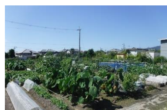
図 3-9 市民農園

「市民農園」とは、レクリエーションなどの目的で、小面積の農地を利用して野菜や花などを育て、食や農に親しむ農園（貸し農園など）のことをいいます。本市では、農家と地域の皆さんのふれあいの場として、また土に親しみ自然にふれる場として、令和4年度（2022年度）末現在、市内5箇所、171区画の市民農園を開設しています。また、令和5年度の新規開設に向け、市営1農園（34区画）、民営1農園（68区画）の整備を行いました。