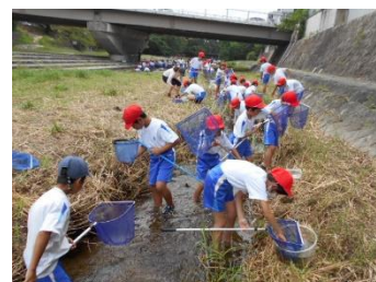
図 3-7 北夙川小学校の環境体験事業

・例年、市立小学校・義務教育学校3年生を対象とした自然にふれあう環境体験事業や、市立小学校・義務教育学校5年生を対象とした自然学校推進事業を実施しています。令和4年度(2022年度)の自然学校推進事業については、本来は4泊5日の宿泊体験を実施していましたが、新型コロナウイルス感染症拡大防止のため主に山東自然の家(朝来市)にて2泊3日の宿泊体験や、甲山自然環境センター等にて日帰り体験等を実施しました。人や自然とのふれあいを通して、心身ともに健康な児童の育成を図っています。