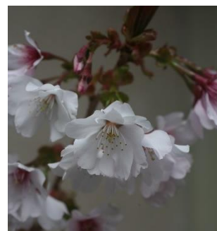
図 3-4 西宮市オリジナル植物 (宮の雛桜)

・北山緑化植物園内にある植物生産研究センターでは、植物バイオテクノロジーを活かし、本市の環境に合った新品種「西宮市オリジナル植物」を開発・展開しています。令和 2 年度(2020 年度)には、「宮の雛桜」が新品種のサクラとして加わりました。