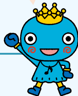
西宮市観光キャラクター みやたん