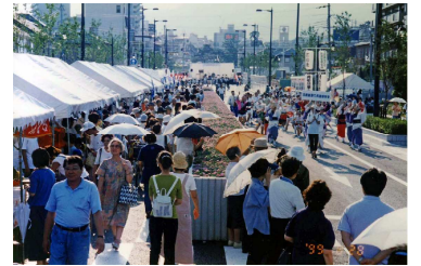
開通前に地元自治会の主催のイベント「人と街と路のまつり」(H11.8)が開催(西宮市)