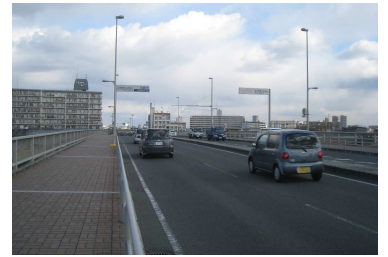
尼崎市と西宮市を結ぶ山手大橋 (西宮市～尼崎市)