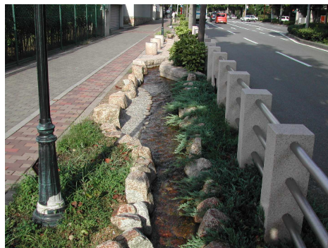
歩道内に整備したせせらぎ水路。憩いの空間を提供。(神戸市)