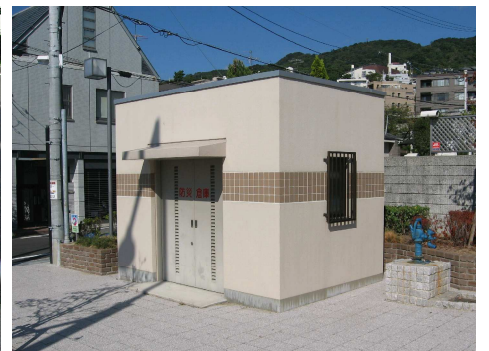
山手幹線沿線には防災倉庫5箇所、防火水槽を2箇所整備し、地域の防災力向上に寄与(芦屋市)