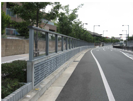
光触媒型吸音ブロックを用いた遮音壁、歩道材料にも光触媒加工されたものを使用。電線類地中化も実施し、環境、景観に配慮(芦屋市)