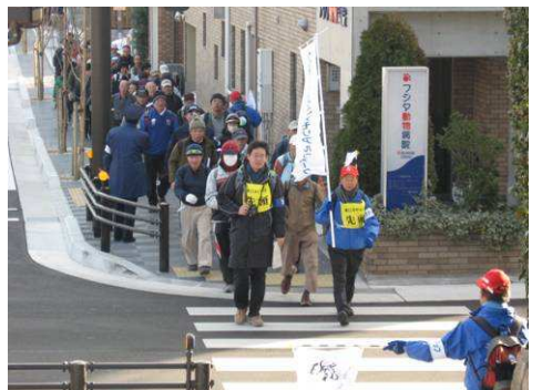
阪神・淡路大震災のあった1月17日には、緊急時の避難路、救援路となる山手幹線を歩くイベント「ひょうごメモリアルウォーク」が毎年開催。毎年数千名の参加者がある。