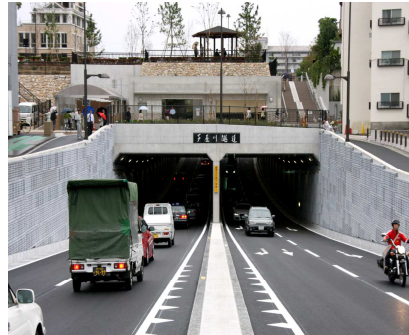
芦屋川隧道(芦屋市) 当工区の供用により、悲願の山手幹線が全線開通