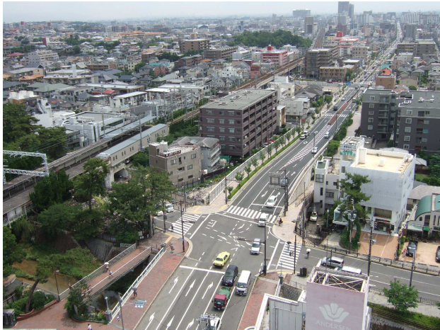
全線開通した山手幹線 (阪急夙川駅より東)