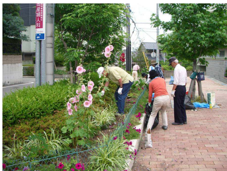
沿道の自治会によって維持管理していただいている道路内の花壇(西宮市)