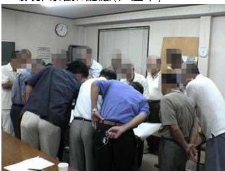
地域住民の参画と協働を得て、事業計画を策定(尼崎市)