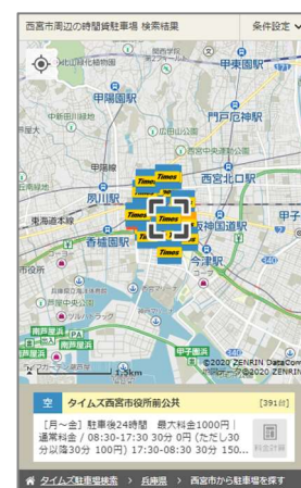
時間貸駐車場の満空情報 (タイムズの駐車場検索 Web サイト)