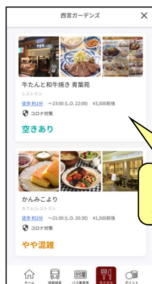
スポット詳細情報(ぐるなび連携)