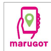
アプリロゴマーク