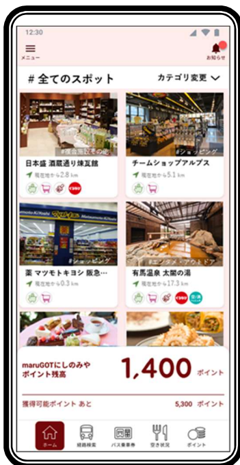
ホーム画面(モニター用)