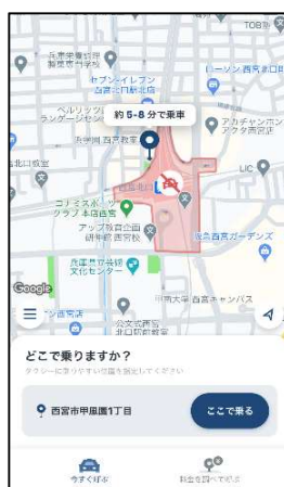
タクシーの配車手配 (タクシーアプリ「GO」)