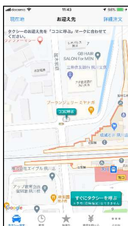
タクシーの配車手配 (阪急タクシーアプリ)