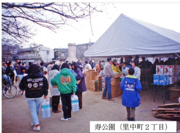
寿公園(里中町2丁目)