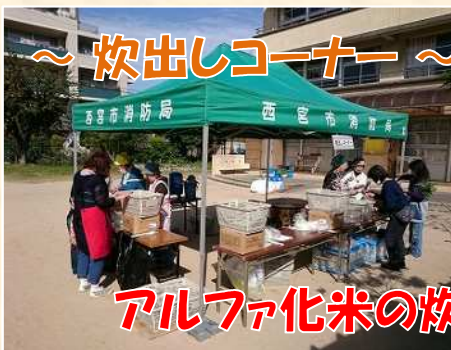
アルファ化米の炊出しを実施