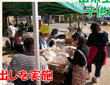
出来上がったアルファ化米を 子供たちが参加者へ配膳