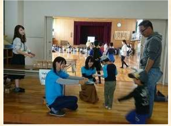
子供向けにクイズ形式で防災講座を実施