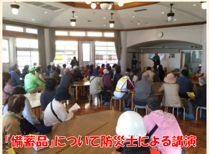
「備蓄品」について防災士による講演