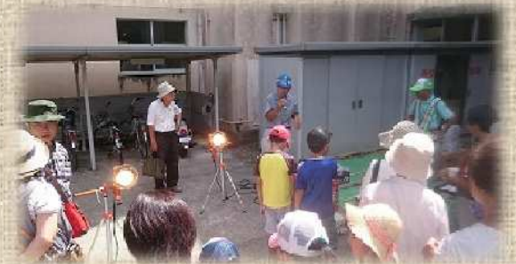
発電機、投光器、バール、etc