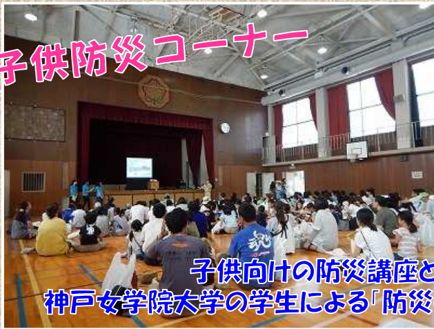
子供向けの防災講座と、神戸女学院大学の学生による「防災ウォッチ」を実施

＜防災ウォッチ＞ 身近なものを妖怪に例え、災害時に「襲ってくる妖怪」「助けてくれる妖怪」を見つけるゲーム