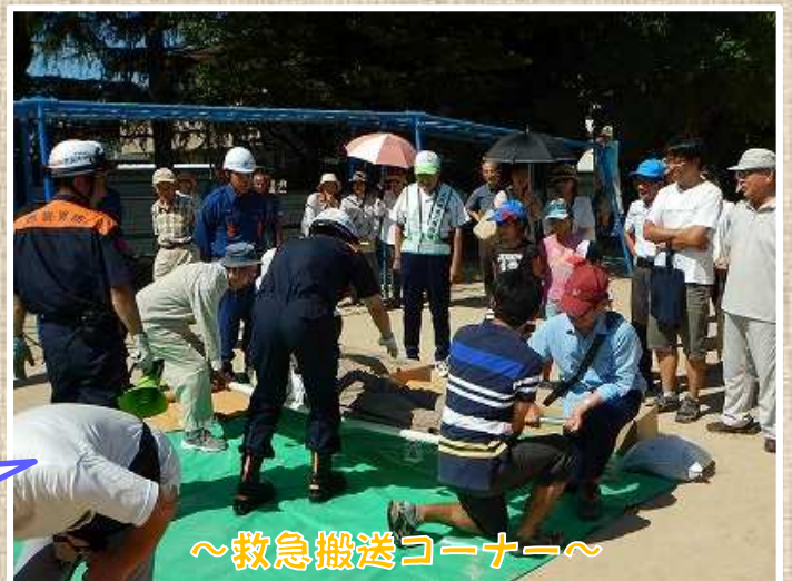
～救急搬送コーナー～