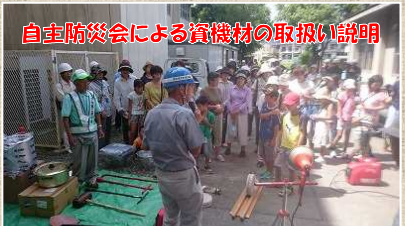
防災倉庫の中には自主防災会で使用する各種資機材が入っています。