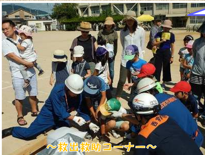
～救出救助コーナー～