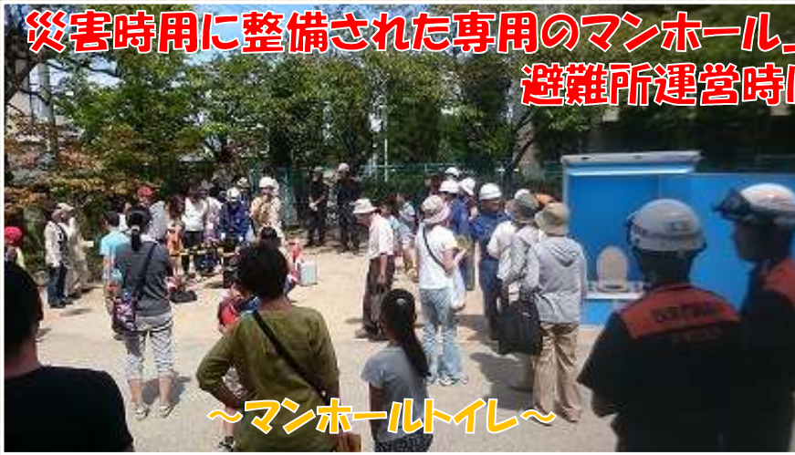
～マンホールトイレ～

災害時に整備された専用のマンホール上にトイレを設置 避難所運営時は仮設トイレとして活躍!!