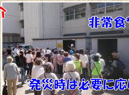
発災時は必要に応じて市内各所の避難所へ