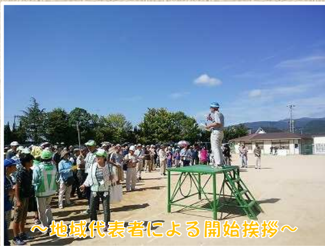
～地域代表者による開始挨拶～

参加者は到着後、グラウンドに集合。 地域自主防災会の代表者による挨拶で訓練を 開始！