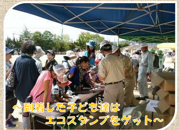
～到着した子ども達は エコスタンプをゲット～