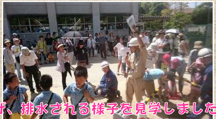
参加者は手動ポンプで水を汲み上げ、排水される様子を見学しました