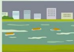
川が濁ったり、 流木がまざり始める。