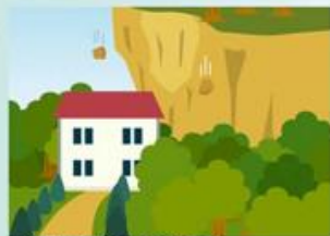
がけに亀裂が入る。 がけから小石が落ちてくる。