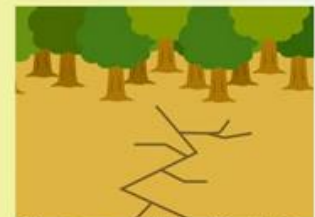
地面にひび割れができる。