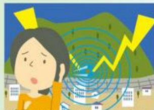
地鳴りの音が聞こえてくる。