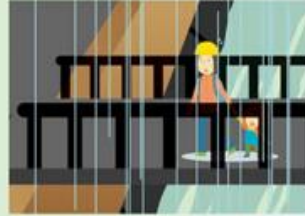
雨が降り続けているのに、川の水位が下がる。