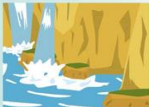
わき水の量が増える。