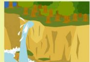
斜面から水が噴き出る。