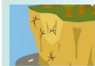
斜面にひび割れができる。