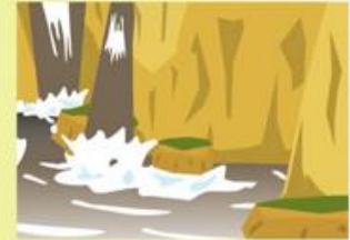
がけから出る水が溢る。