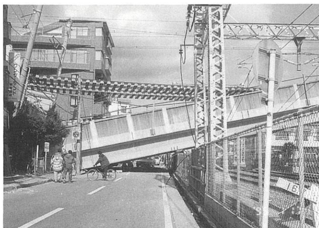
落橋した新幹線（松籟荘）