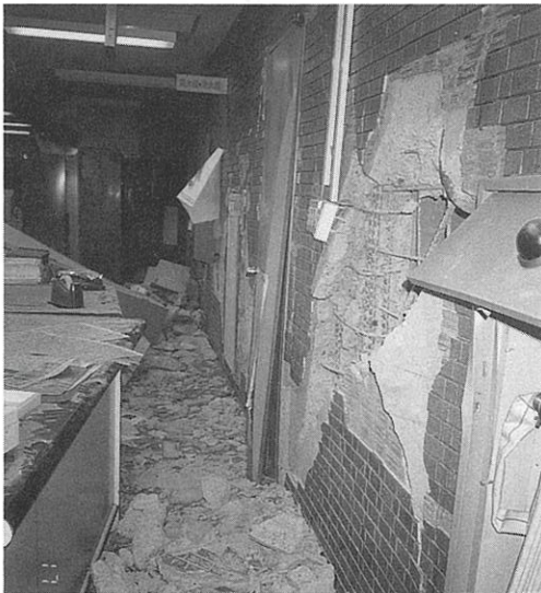
市役所6階付近の状況