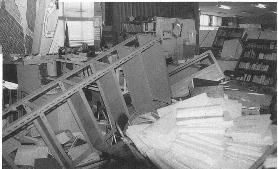
消防局消防部事務所の状況