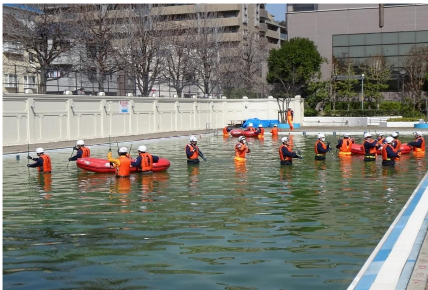
避難用ゴムボート取扱訓練