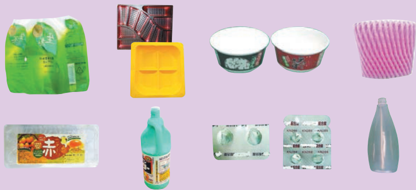
プラスチック製容器包装