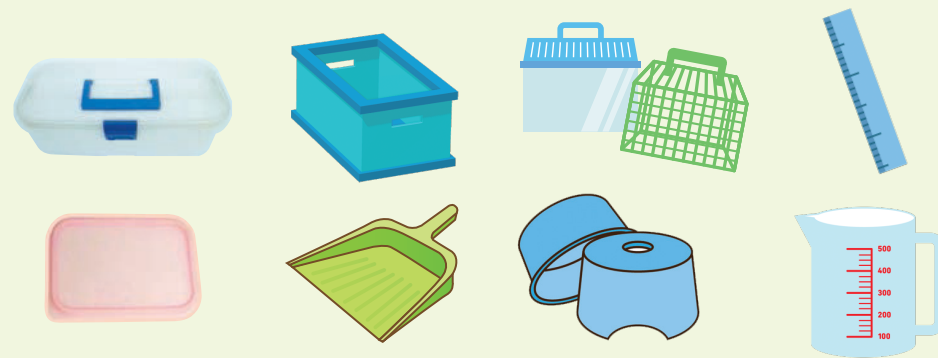
文房具類・収納用品・洗面用具・台所用品など