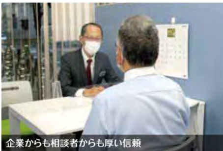
企業からも相談者からも厚い信頼