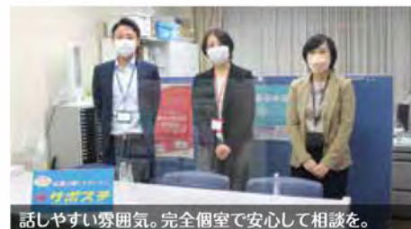
話しやすい雰囲気。完全個室で安心して相談を。

パソコン講座をはじめ様々なセミナーも開催。一歩踏み出すきっかけを一緒に見つけませんか。