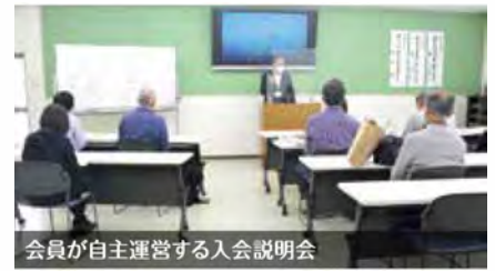
会員が自主運営する入会説明会

公園パトロールや広報紙の仕分け・配布や家事援助、施設の受付業務など、さまざまな仕事にチャレンジしたり、同好会で親睦を深めたり・・・個別の就労相談も受けられます。「自主・自立・共働・共助」の理念のもと、約2300人の会員が登録。80歳を超えても元気に生き生きと働いている会員もいて、勇気づけられます。