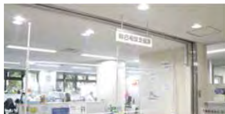
働きたい人と雇いたい人をつなぐ相談窓口。明るく開放的です。