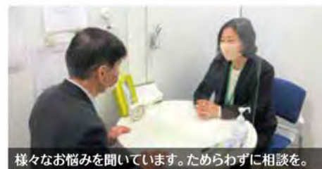
様々なお悩みを聞いています。ためらわずに相談を。

失業して困っている、生活が苦しい、就職活動が行き詰っている、など生活や仕事にお困りのときは、まずご相談ください。生活を立て直し、自立できるように支援プランを作成し、他の専門機関と連携して、解決に向けた支援を行います。