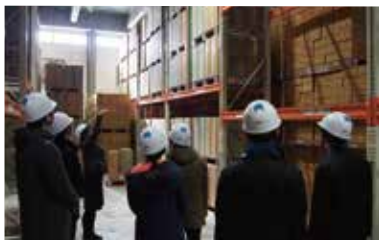
職場見学・体験、就活に役立つセミナーを随時開催しています。