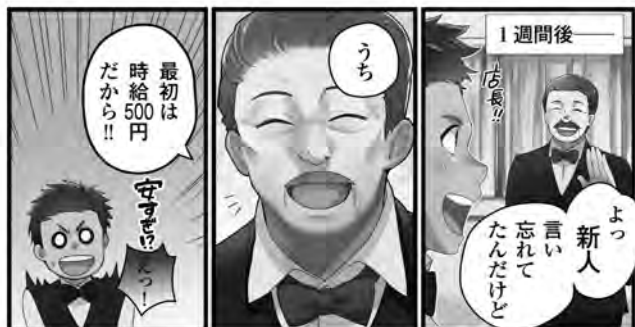
厚生労働省「これってあり?~まんがが知って役立つ労働法Q&A