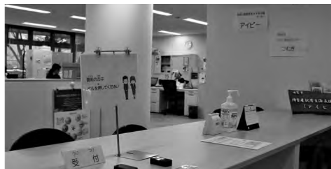
西宮市障害者就労生活支援センター「アイビー」

西宮市梁殿町8-17 西宮市総合福祉センター内 TEL.0798-22-2725 FAX.0798-22-2724 9:00~17:30 月~金曜日(土日祝休み)