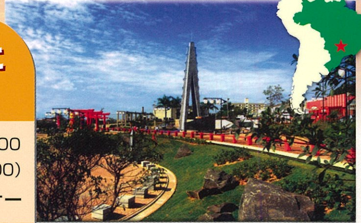
ロンドリーナ市にある中川トミ公園