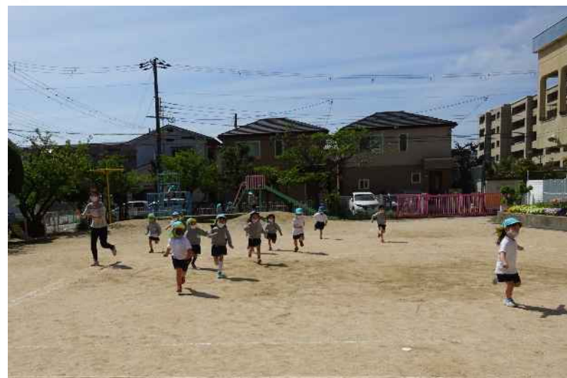
高木幼稚園の園庭で思いきり走る園児達

待機児童対策として、公立幼稚園で特区小規模保育事業（1～3歳児対象）の卒園児を受け入れ、新たに預かり保育（長時間保育）を実施する。 ・令和4年度：夙川幼稚園、高木幼稚園で4歳児の受入開始