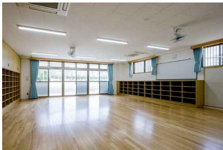
整備後のセンター室内

・留守家庭児童対策施設整備事業（上甲子園留守家庭児童育成センター） / 160,818千円 / R5