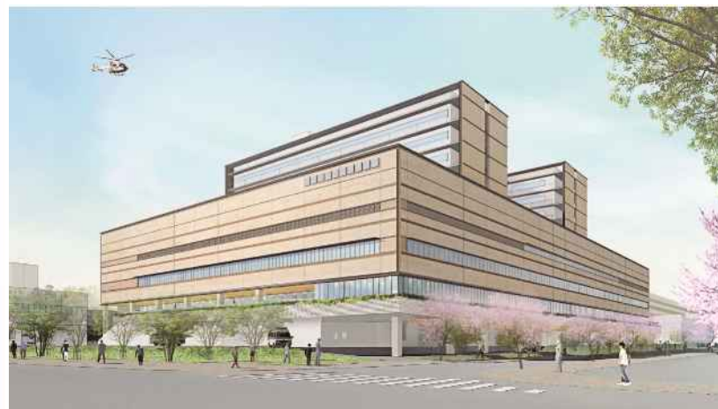
統合新病院完成イメージ