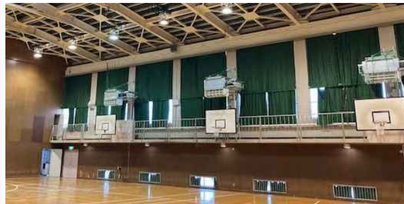
中学校に設置した体育館空調