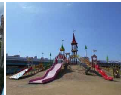
みやっこキッズダム