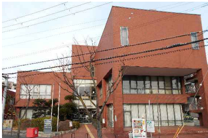
現在の越木岩センター