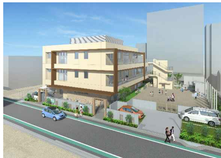
建替え後の津門保育所・津門児童館イメージ

・公立保育所改築等整備事業（津門保育所・津門児童館） / 19,583千円 / R5