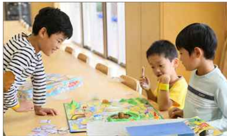
放課後キッズルームの様子