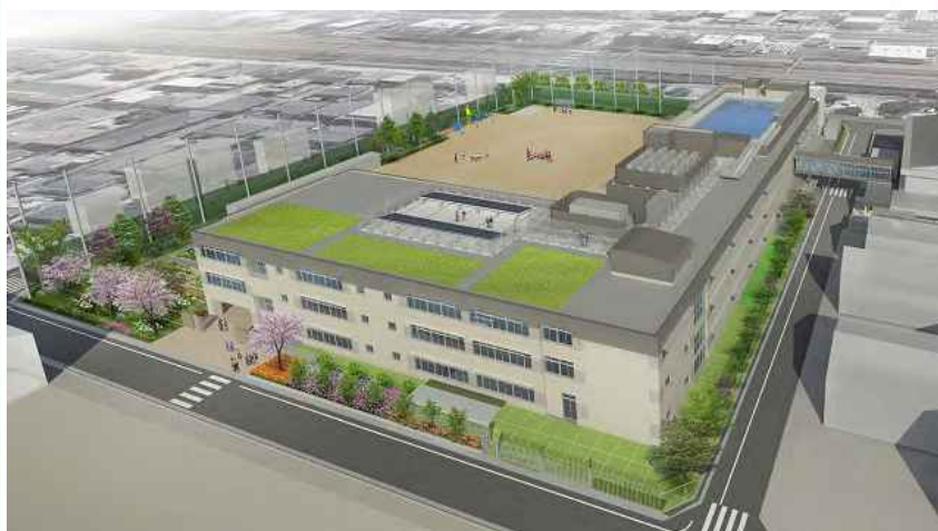
安井小学校校舎改築イメージ