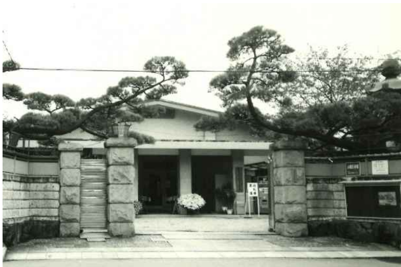
開館当時の大谷記念美術館

令和4年度は、開館50周年を迎えることから、周年事業の開催に伴い、補助額を増額する。