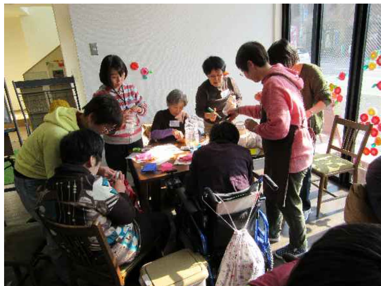
地域交流拠点の様子