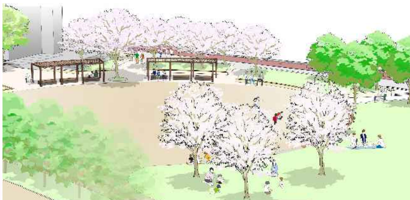
再整備後のグラウンドイメージ