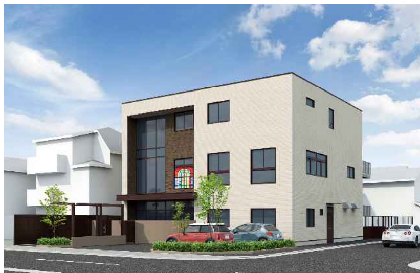
令和4年4月開園予定の民間保育所イメージ

待機児童の解消に向けて、保育所・幼保連携型認定こども園等を整備する社会福祉法人等に対し、施設整備費を補助する。また、定員拡大や耐震化を目的として保育所の建替え等を実施する法人に対し、整備費用を補助する。