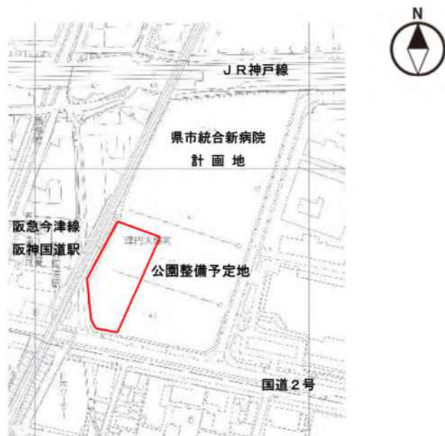
公園整備予定地 位置図