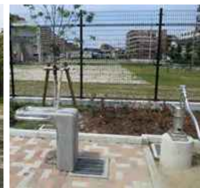
水飲み場と手押しポンプ