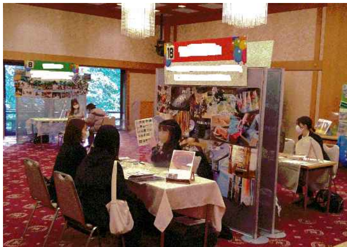
就職フェアの様子

・令和4年度：西宮市内の民間保育所等に就職した保育士を対象とした一時金の支給事業を実施