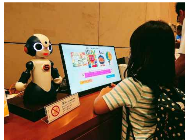
共同研究事業（AI絵本検索システム「びたりえ」）

《 当該事業における新規債務負担行為の設定：事項 / 限度額 / 期間 》 ・北部図書館及び分室管理運営等業務委託料 / 332,114千円 / R5-R7