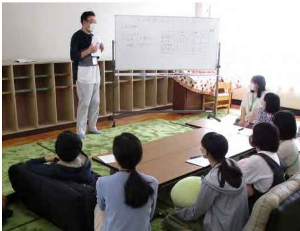
あすなる学級の様子