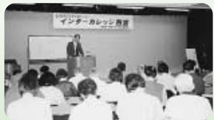
熱心に講座に聞き入る受講生の皆さん