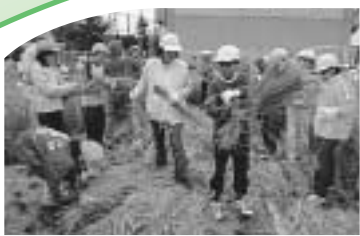
子どもたちに様々な体験の実現を