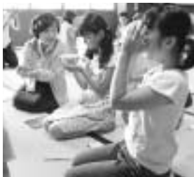
興味のあることにチャレンジしよう!

教育委員会は、11月に開講する平成16年度後期「宮水ジュニア」の受講生を募集します。同講座は、地域の皆さんなどを講師に迎え、子どもたちの興味・関心を広げながら、異年齢間の交流を図るものです。