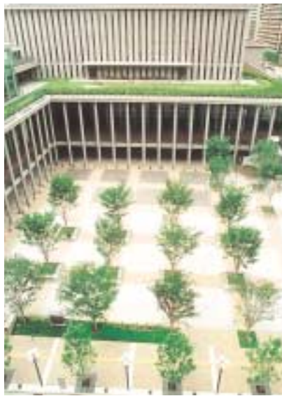
ケヤキのベンチが並ぶ高松公園(上・右写真) 同公園でオープン時に開催した「まちかどコンサート」の様子(下写真)