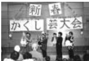
▲新春かくし芸大会