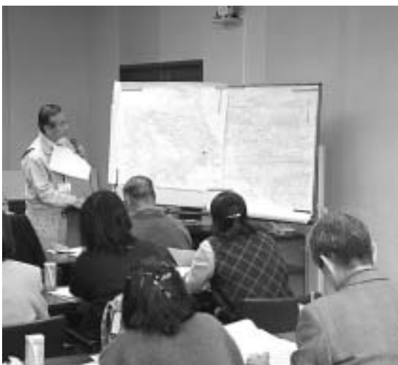
平成17年度の水道モニター会議の様子

また、品質管理の水質検査については、毎月検査を基本に必要に応じて回数を増減します。その他の取り組みとして、安全を確保するためには、水源から蛇口まで総合的に