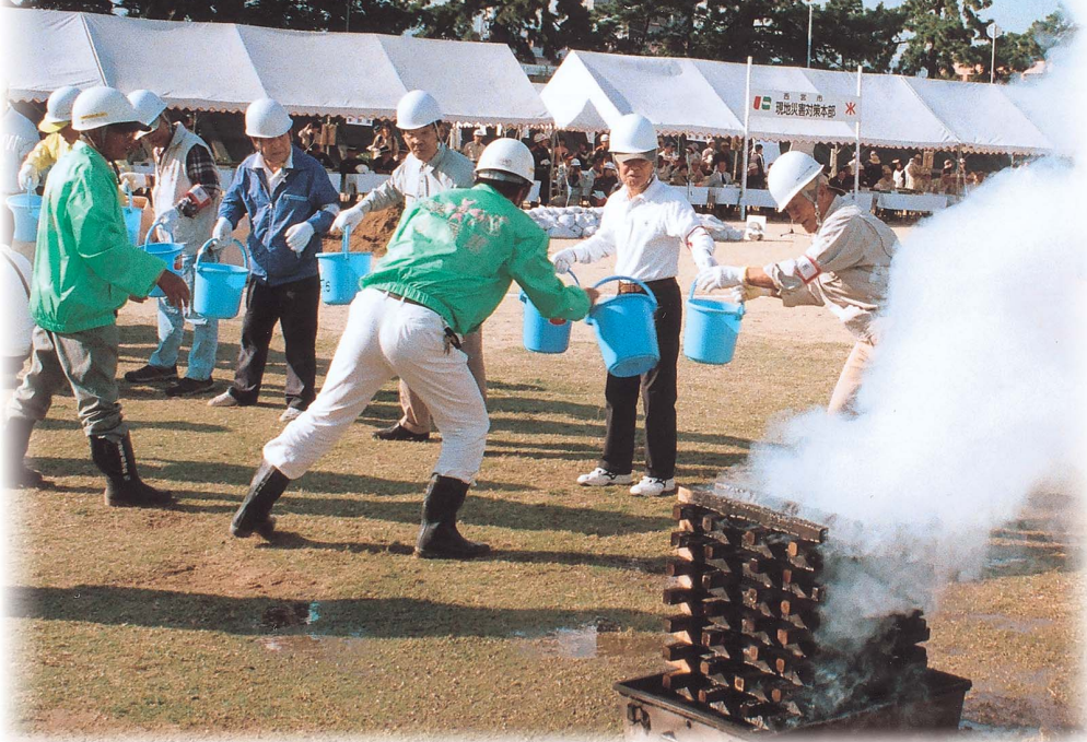
みんなで力を合わせ、安心して暮らせるまちづくり(昨年の総合防災訓練)

阪神・淡路大震災から12年が経過し、まちなみは復興を遂げましたが、災害は、またいつ起こるか予測できません。市は、震災の体験を教訓とし、災害による被害を少しでも減らすため、地域防災力の向上、防災意識の啓発・推進に市民の皆さんと共に取り組んでいます。 しかし国内外では、地震、津波、台風、集中豪雨などの自然災害が絶えず発生し、JR福知山線の脱線事故などの大規模事故やテロ、感染症のほか、身近なところでは空き巣やひったくりが増加するなど、私たちのくらしに影を落とす災害・事故も増えてきています。 これまで市民の安全を守る市の組織は、防災対策は土木局、危機管理は総合企画局、防犯は市民局というように、異なる部署が担当していました。4月からは、防災・安全に関するこれらの組織を統合・整理し、総合的な調整機能を備えた新しい組織として「防災・安全局」を新設しました。様々な事態に対し迅速かつ的確な対応を行うため、危機管理全般を一つの局で総括し、指揮することになります。 3つのグループが一丸となって市民の皆さんの安全・安心を守る「防災・安全局」。それぞれのグループの取り組みを紹介します。