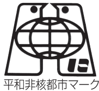
平和非核都市マーク

西宮市は、昭和58年12月に「平和非核都市宣言」を行いました。このシンボルマークは、地球をハトで包み恒久平和の願いを表現しています。