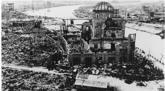
広島県産業奨励館と爆心地付近

原水爆禁止西宮市協議会、市などは、7月23日から28日まで、ギャラリーフレンテと西宮市国際交流協会展示コーナー(いずれもフレンテ西宮4階)で「原爆展」を開催します。