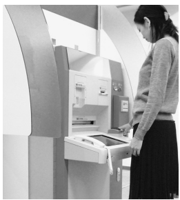
設置される証明書自動交付機

なお、証明書自動交付機の利用には「住民基本台帳カード」または「にしのみやカード」が必要で、カードについて詳しくは市民窓口グループ（0798・353・3108）へお問い合わせください（本紙9月10日号2面でも紹介しています）。