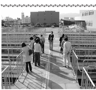
浄水場見学会の様子