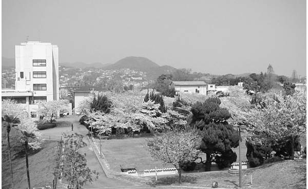
春には桜の通り抜けも開かれる越水浄水場

本市の水道施設は、昭和30年代から40年代に建設されたものが大半で、間もなく更新時期を迎えます。将来にわたって水道水を安定的に供給していくため、水道施設の整備が重要な課題となつていきます。