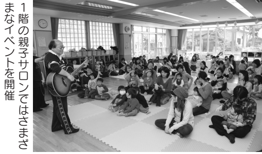
1階の親子サロンではさまざまなイベントを開催

子育て総合センターは、幼稚園・保育所の概要、子育てサークルの情報などさまざまな子育て支援情報を提供しています。また、子育て支援のための事業として、親子で楽しめる絵本の読み聞かせやリズム体操などの催し、講演会、子育てサークルの交流などを行っています。