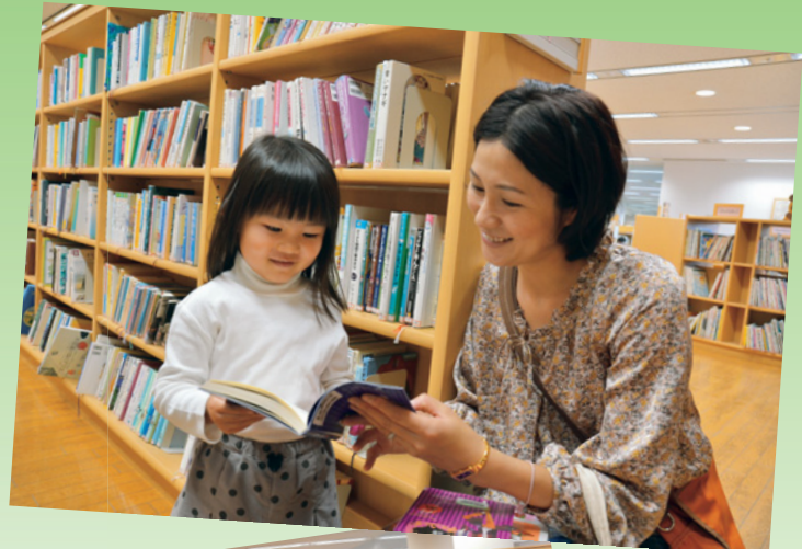
大人から子どもまで誰もが利用できる図書館。皆さんの近くの図書館を気軽にご利用ください