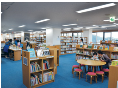
窓が大きく明るい雰囲気の中、ゆったりと読書ができます

山口分室は、今年4月から、「日曜開室」を実施し、多くの人が利用できるよう利便性の向上を図っています。図書館の分室では最大規模の広さを誇ります。