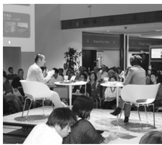
まちづくり塾での講義風景

西宮まちづくり塾は、さまざまな視点からまちづくりの取り組みに取組んでいる人を講師に招き、まちづくりについて学び考え、参加者同士が交流できる場です。