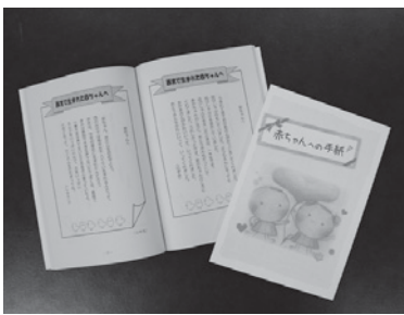
「赤ちゃんへの手紙」冊子

市は、「赤ちゃんへの手紙」事業を実施しています。この事業は、西宮アロバスクラブから市が引き継いで実施しているもので、市立小学校の子どもたちから西宮に生まれてきた赤ちゃんへ手紙を贈るといったもので