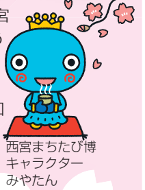
西宮まちたび博キャラクター みやたん

市と西宮観光協会は4月8日(日)を中心に、「日本さくら名所100選」に選ばれている夙川公園一帯で「西宮さくら祭」を開催します。例年咲き誇る桜を見ようと約10万人の来場者でにぎわいます。46回目となる今年は、「みやたん」も登場するステージやビンゴ大会、またお花見ウォークをはじめとする参加型イベントが開催されます。主なイベントは次のとおりです。詳しくは市役所本庁舎・各支所、市内主要駅等で配布するパンフレットや西宮観光協会のホームページ( http://nishinomiya-kanko.jp/ )をご覧ください。また当日は会場周辺の混雑が予想されます。安全には十分注意し、係員や警備員の指示・誘導に従ってください。