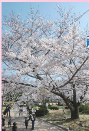
越水浄水場(満池谷)

アクセス: JR甲子園口駅徒歩15分 瀬戸内海から山並みを越えて日本海までつながる桜みち「兵庫県ふるさと桜つつみ回廊事業」の瀬戸内海側の起点と位置付けられており、7種類約1000本の桜が楽しめます。