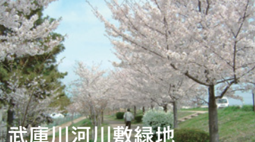
武庫川河川敷緑地

アクセス: さくらやまなみバス下山口停留所すぐ 市の北西部を流れる有馬川沿いに1・3kmの緑道が整備されています。ヤマザクラやソメイヨシノが咲き乱れ、初夏にはホタルを見ることができます。