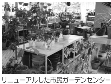
リニューアルした市民ガーデンセンター

【市民ガーデンセンター】庭やコンテナで楽しむ季節の植物、植物生産研究センターが開発した「エンジェルズ・イヤリング」などの西宮市オリジナル植物をはじめ、四季折々の草花や園芸資材を販売しています。