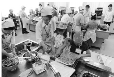
家庭でできるエコ活動を学びましょう