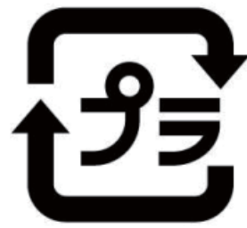
このマークが目印です

市は、容器包装リサイクル法の施行をうけ、平成25年2月から国道2号より南、4月から国道2号より北の地域で、その他 プラスチック製容器包装の資源収集を開始します。 ごみの中から、少しでも利用できるものを資源として有効活