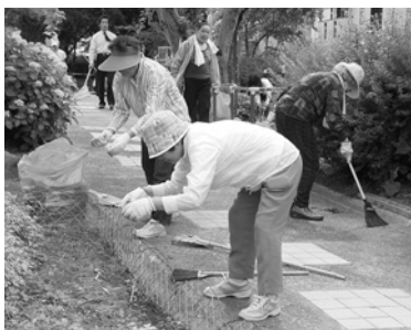
昨年わがまちクリーン大作戦の様子

市と西宮市環境衛生協議会、西宮市ごみ減量等推進員会議 は、6月3日(日)に「わがまちクリーン大作戦」を実施します。 市民の皆さんで組織されている団体や学校、事業所など協