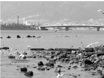
渡り鳥が飛来するなど、多様な生物が見られる甲子園浜の干潟