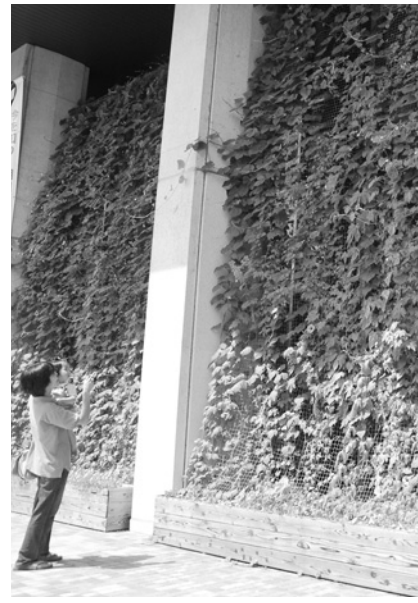
市役所本庁舎前の「緑のカーテン」は室温の上昇を防ぎます

市は、「持続可能な地域づくりEcoプラン」西宮市地球温暖化対策地方公共団体実行計画(区域施策編)を策定し、この中で、市域から排出される温室効果ガス(二酸化炭素など)を、2020年度までに10%(基準年度は1990年度)削減することを目標としています。問合せは環境・エネルギー政策課(0798・35・3381)へ。