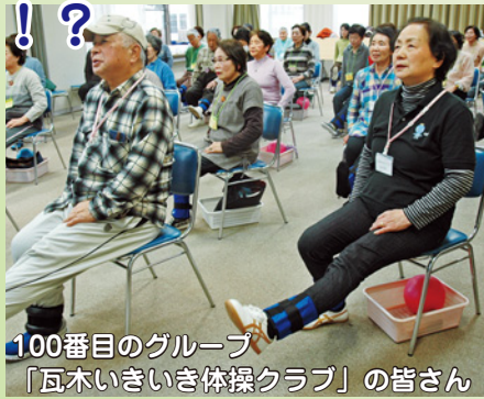
100番目のグループ「瓦木いきいき体操クラブ」の皆さん

おもりの量を調整したり、いすに座ったまま体操したりすることで、 体力に自信がなくても皆さんと一緒に取り組みます!