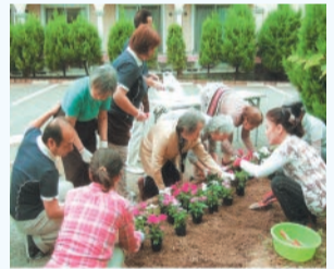
高齢者施設の利用者と一緒 に花壇作り

守りができません。それにより、子供たちは公園で安心して遊ぶことができません。みんなが集まり、公園が賑