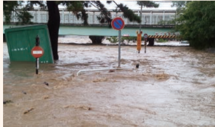
阪神武庫川駅付近