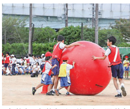
小学生と中学生が一緒にいる運動会

市は、市内に小中一貫ブロックを設置し、地区ごとの教育課題に沿った取組を行ってまいりました。その中でも、西宮浜小・中学校は校区が全く同一であることを生かし、小中合同運動会や地域の清掃活動などを行ってまいりました。さらに、9年間を通じた教育の在り方について、教員の研修を実施してまいりました。平成10年の開校から小中連携に取り組んできた西宮浜小・中学校が、西宮型小中一貫教育のパイオニア（先駆者）となります。