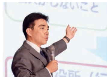
▲瓦木中学校でゴミ問題について授業

市民の皆さんと、プラスチック製ごみによる海洋汚染などの問題についての課題を共有し、身近でできることをひとつずつ実践していきたいと思っております。豊かな地球の環境を守り、美しい地球を将来の世代に引き継ぐため、強い意識で環境問題に向き合う西宮市を一緒に作っていきましょう。