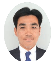
石井 登志郎 市長

4月15日に行われた西宮市長選挙と西宮市議会議員補欠選挙の選挙結果をお知らせします。 問合せは選挙管理委員会(0798・35・3732)。