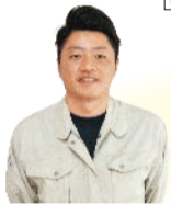
美化第1課 阪巻班長