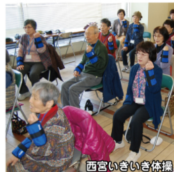
西宮いきいき体操