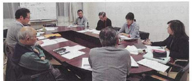
みやしるべ編集会議風景

次ページ以降のNPO訪問記は市内のNPO部会の皆様にアンケートを実施し「みやしるべ」への取材へ「協力できる」と回答して下さった34団体の中から11団体へお伺いしたものです。