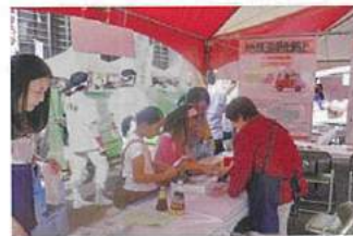
にしのみや市民まつり