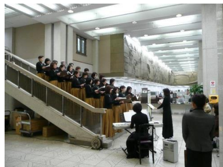
市役所内ロビーコンサート