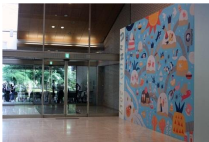
毎年西宮市大谷記念美術館で好評を博しているイタリア・ポーロニャ国際絵本原画展