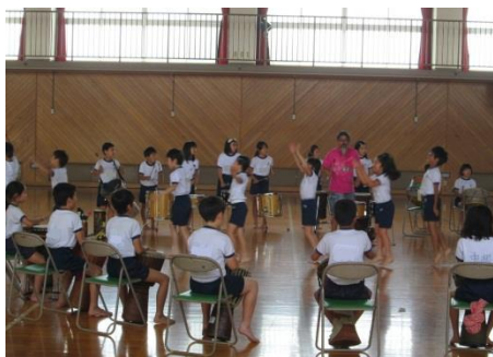
小中学校アウトリーチ事業(民族楽器)