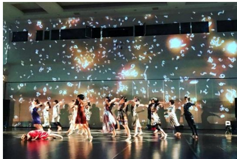
フレンテ・ダンスジュエルズ。東野祥子構成・振付による市民参加プログラム。公共ホール現代ダンス活性化事業