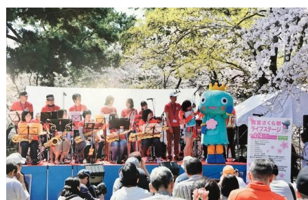
夙川さくら祭ライブステージ